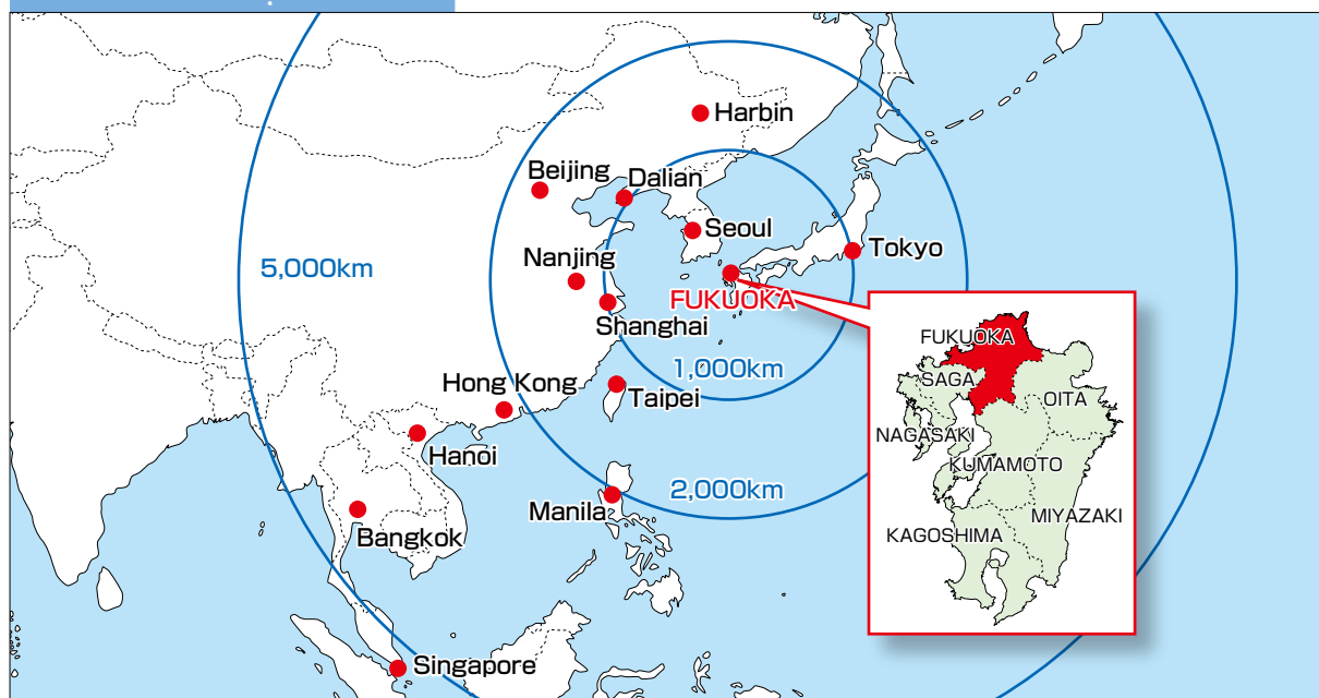
Bản đồ vị trí

※ Kiểm tra các chi tiết trong Hướng dẫn tuyển sinh được công bố trên trang web của chúng tôi.