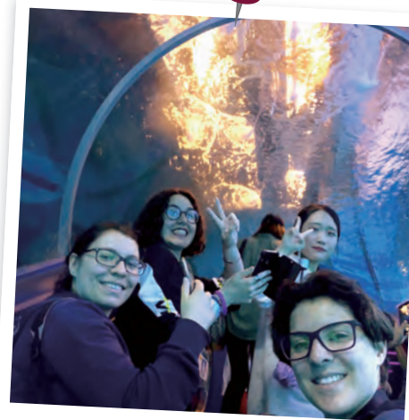
八景島シーパラダイス