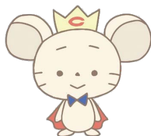
中央大学マスコットキャラクター 「チュー王子」 Prince Chu, Mascot of Chuo University

中央大学入学センター事務部入試課 〒192-0393 東京都八王子市東中野 742-1 Chuo University Admissions Office 742-1 Higashinakano, Hachioji-shi, Tokyo 192-0393 JAPAN Mail admissions-grp@g.chuo-u.ac.jp URL http://www.chuo-u.ac.jp