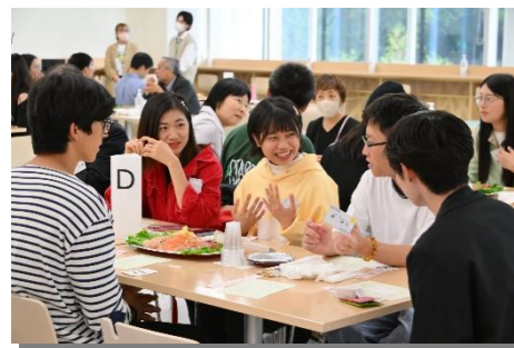
新入留学生歓迎会は一大イベント！留学生が居住するアパートのオーナー様も来場するほどに留学生との距離感が近い